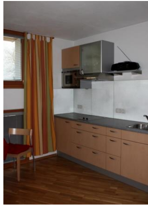
EG - Küchenblock