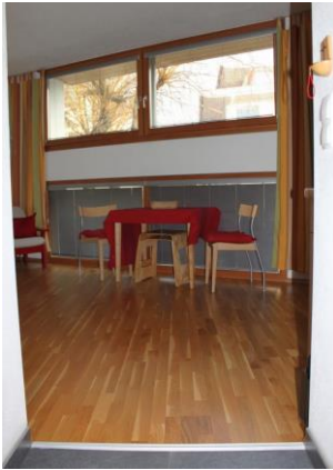
EG - Eingang