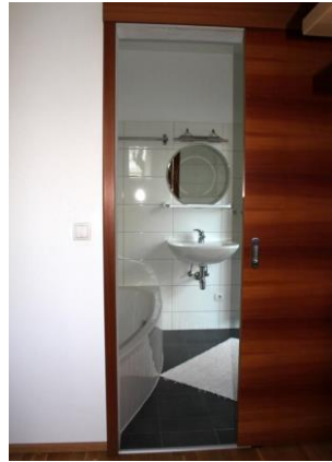
EG – Eingang Bad