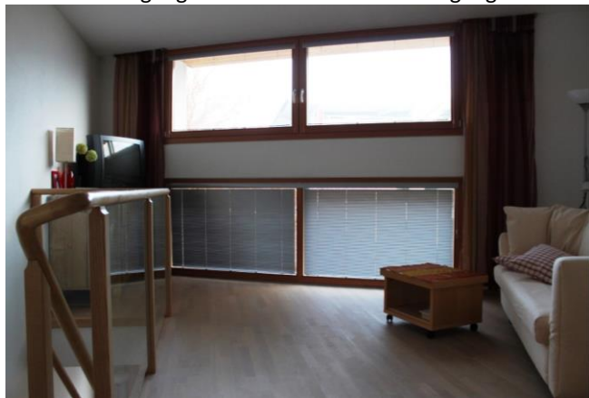
OG – Osten

Sehr helle, ostseitig ausgerichtete 2-geschoßige Wohnung mit Parkettböden, Holztreppe und großen Fenstern; an Einzelperson; bei Kontaktaufnahme bitte kurze persönliche Vorstellung; keine Haustiere; Nichtraucher(in);